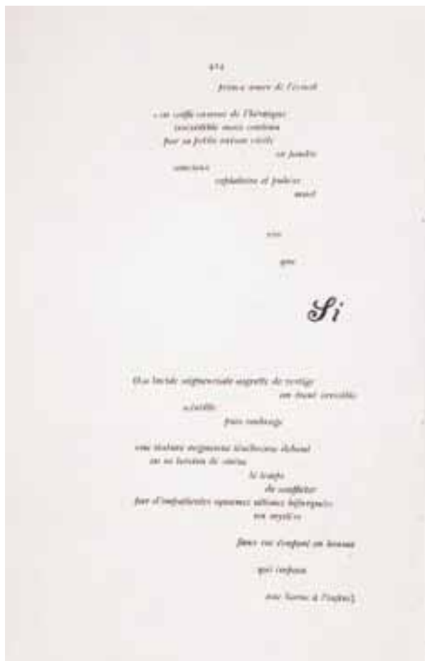
Stéphane Mallarmé, Un coup de dés jamais n'abolira le Hazard (1897) iv